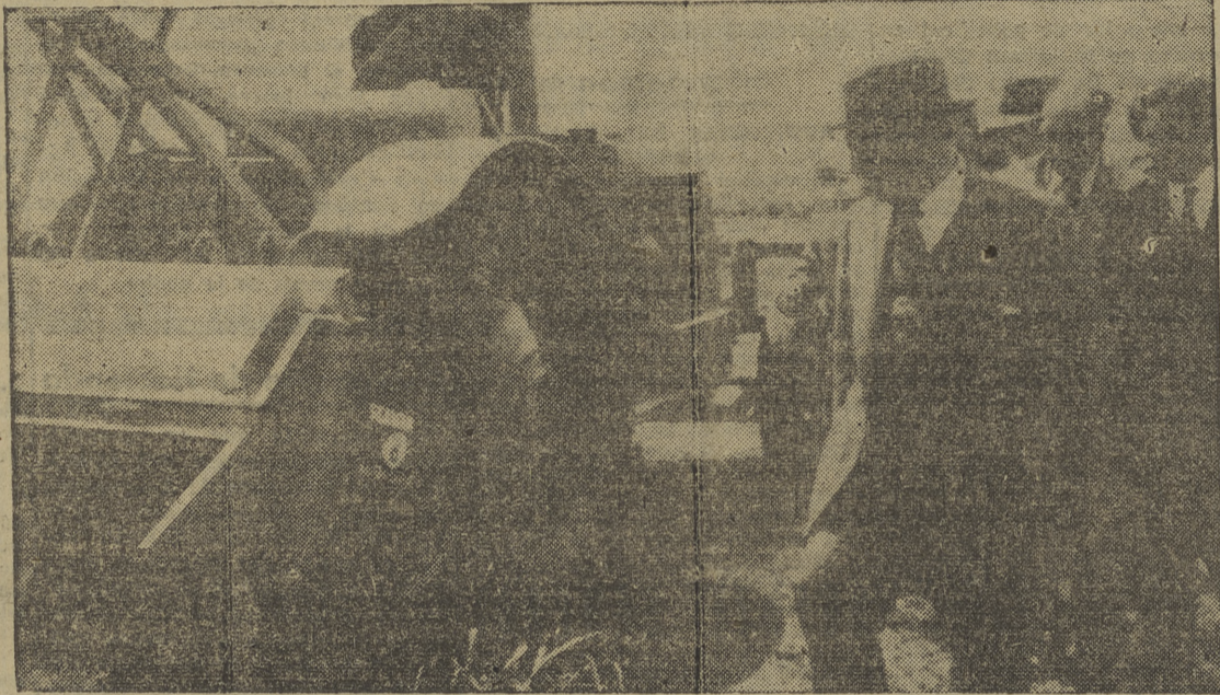
S. E. el Jefe del Estado, acompañado de ministros y autoridades, presencia el funcionamiento de la maquinaria de labranza pesada, durante su visita a las zonas regables del Guadalquivir.

La zona regable del Viar tiene una superficie total de trece mil trescientas ochenta y cuatro hectáreas y comprende terrenos situados en la margen derecha del río Guadalquivir, pertenecientes a los términos municipales de Cantillana, Valverde del Río, Burguillos, Breaños, Alcalá del Río, Gullanes y Alcalá de Guadaíra.