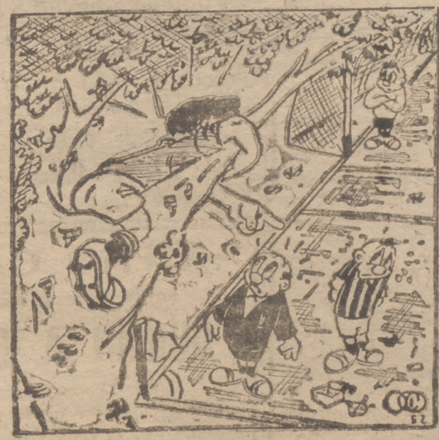
«¡Ese, ese... señor árbitro...!»