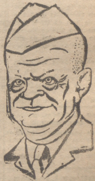
Eisenhower contesta a tres preguntas sobre España

Hace dos semanas, los soviets dejaron pasar seis tanques "Patton" en tren, pero el sábado los rusos comenzaron a inmiserse en los abastecimientos militares y se negaron a dejar pasar dieciocho autobuses del Ejército que se traían en tren a Berlín. Los tanques iban en un tren militar. Eran ocho unidades de tipo "Patton" y fueron detenidos en el puesto de Marienborg, frontera de las dos Alemanias. (Efe).