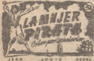
LA MUJER PIRATA

Hoy, a las 5:30, 7:45 y 11 noche Extraordinario acontecimiento Estreno de la realización cumbre 20th Century-Fox, cabeza de lote