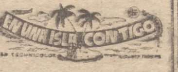
EN UNA ISLA CONTIGO

de la deslumbrante y fastuosa superproducción en tecnicolor