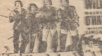
Los hijos de los Mosqueteros

Hoy, a las 5:30, 7:45 y 11 noche EXITO ROTUNDO DE LA SENSACION QUE VB. ESPERABA