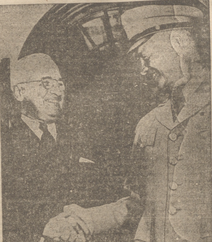
Desde luego sería imposible obtener hoy una "foto" parecida. ¿Cómo cambian los hombres por la política? El presidente no se cansa de acusar al general, y éste contesta llamando a Truman inepto e irresponsable. Una fotografía puede en política resultar completamente anacrónica en pocos días.