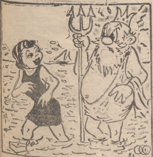
¡No tenga usted miedo al agua, y métase más, abuelo..!