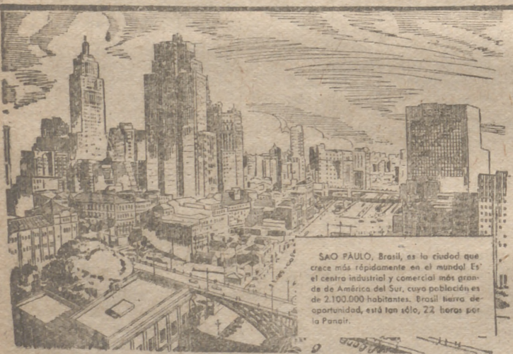
SAO PAULO, Brasil, es la ciudad que crece más rápidamente en el mundo. Es el centro industrial y comercial más grande de América del Sur, cuya población es de 2.100.000 habitantes. Brasil, tierra de oportunidad, está tan sólo, 22 horas por la Panair.