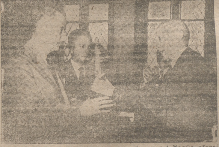
El general Larios, que ostentaba la representación del capitán general de la región, en el acto de hacer entrega al tesoro de la Federación Francesa de Lucha, de la copa que el general Yagwey ofrecía al equipo vencedor de la reunión internacional.

Declaraciones del general Dodd sobre su cautiverio en Koje