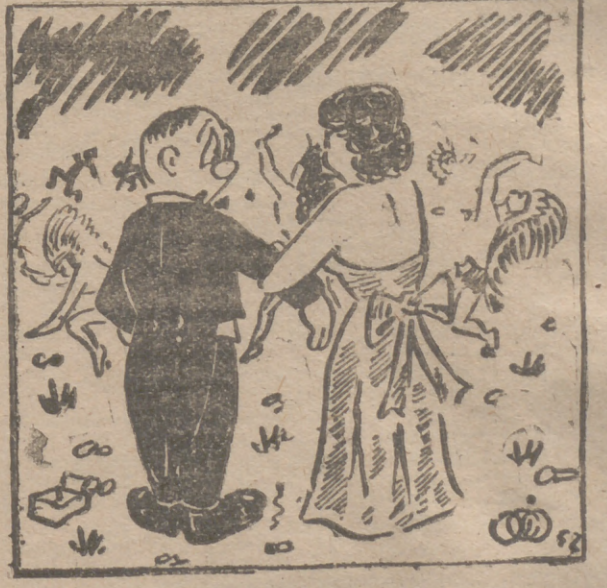
—Pues te juro que el papá decía: "Aguila Negra tiene el honor de invitarles al baile de..."