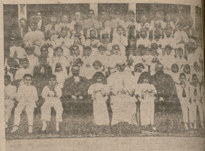
Grupo de niños, alumnos del Liceo Castilla, de los Hermanos Maristas, que el domingo hicieron su primera comunión.