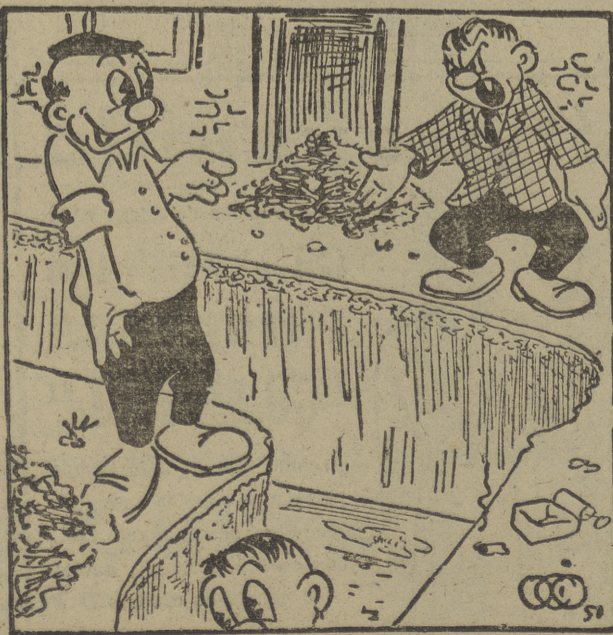
—Es que dicen que por este "lao" está el terreno más blanco...!