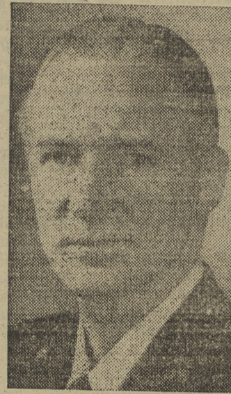
El coronel Anthony J. Drexel Biddle Jr., que ha sido designado jefe de Estado Mayor del general Eisenhower.

El presidente Truman ha pedido hoy el levantamiento de las restricciones que figuran en el tratado de paz italiano, a fin de "ayudar contra la amenaza de la agresión soviética".