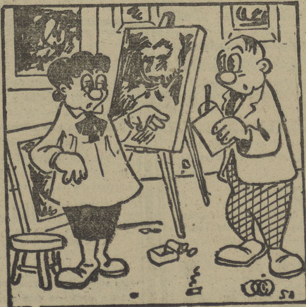
Que cómo empezó...? ¡Pintándose las uñas, ya ve usted...!