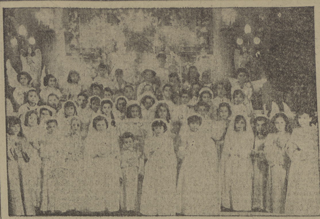
Grupo de niñas del Colegio de Santa Juana que el día de domingo recibieron el Pan de los Angeles, en la solemne ceremonia celebrada en el Convento de las Reverendas Madres Bernardas.

Mac Donald dijo que los ingresos de la "fonovisión" durante el período de prueba han sido de 6.000 dólares, con un promedio de 22'50 dólares por familia durante tres meses, o sea, 1'75 dólares por semana.—Efe.