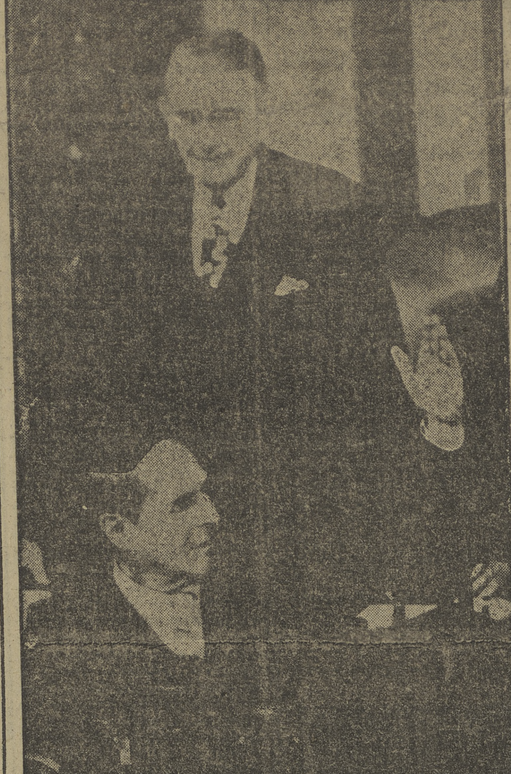
El general Mac Arthur durante su importante discurso en Washington a ambas Cámaras reunidas en el Capitolio. Detrás de él aparece el vicepresidente Barkley, que presidió el acto.