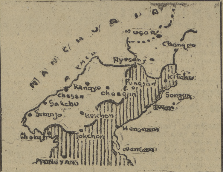
Esta es la situación de la guerra en Corea, según los últimos comunicados

Circulan rumores de que los comunistas chinos están celebrando negociaciones de paz