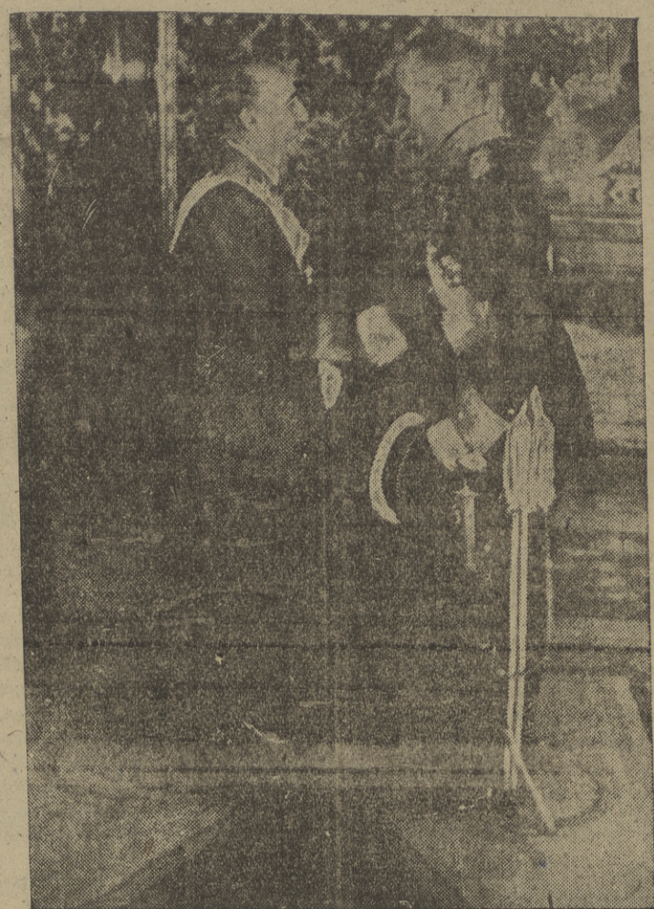
El Generalísimo recibe al nuevo embajador de la República Argentina, don Oscar R. Silva, en el acto de presentación de sus cartas credenciales.

En el sector Noroeste sólo se ve poca actividad de patrullas. El enemigo se ha atrincherado a distancias que oscilan entre los 14 y los 20 kilómetros de Taechon. Columnas de surcoreanos avanzan a lo largo del ferrocarril de la costa de Taechon a Susong, al Norte del delimitado Orong. Se cree que ciento cincuenta mil comunistas se encuentran fuertemente atrincherados en las zonas defensivas del Noroeste del frente, que se extiende entre Taechon-Unsan y la zona septentrional de Toekchon.