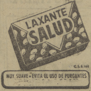
MUY SUAVE - EVITA EL USO DE PURGANTES

ricres, Louvell-Calabozo, haciendo eficaz el juego de conjunto, encontrando un poco bajo de sus facultades al extremo izquierdo, Michalena. Zuazo y el extremo derecha cumplieron, esperando que en la segunda eliminatoria, que se celebrará en Vitoria el día 24 del actual, se rehagan. Resultó un partido entretenido, esperando que en Vitoria no se fiera, ya que éste es un equipo peligroso. A las órdenes del señor Hoyos, los equipos se alinearon de la siguiente forma: VITORIA. — Ullate, Aguinaga, Benigno, José Luis; Barcina, Montañés; Fortunato, Iragorri, Montaña, Oyarzábal y Iturrospe.