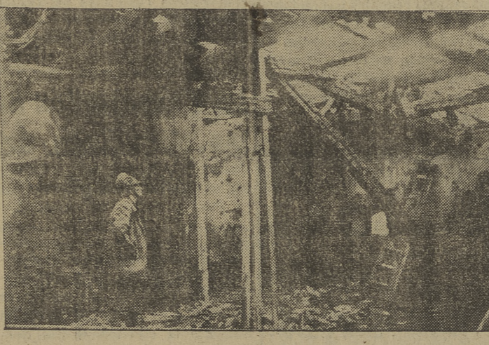
Un aspecto de las destrucciones originadas por el incendio producido ayer en el Asilo de las Hermanitas de los Pobres. — Información en segunda página de nuestra edición para Burgos.