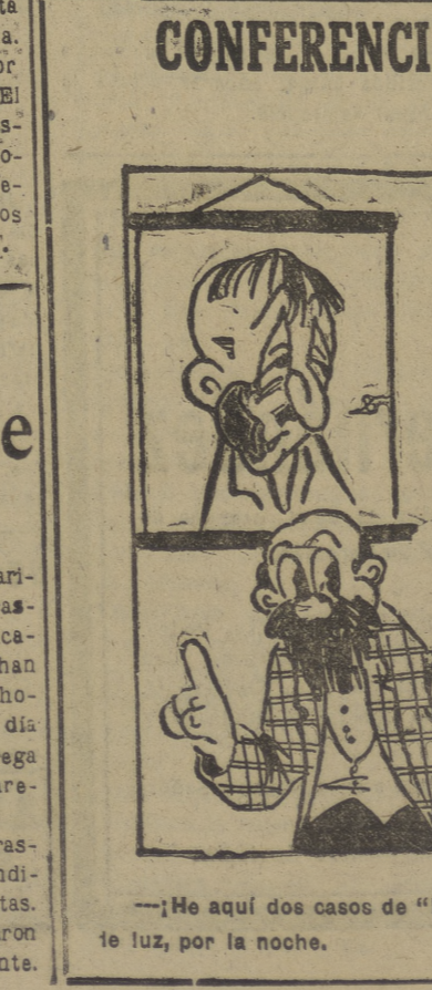
—¡He aquí dos casos de “hipo”! Falta de vitaminas... y falta de luz, por la noche.