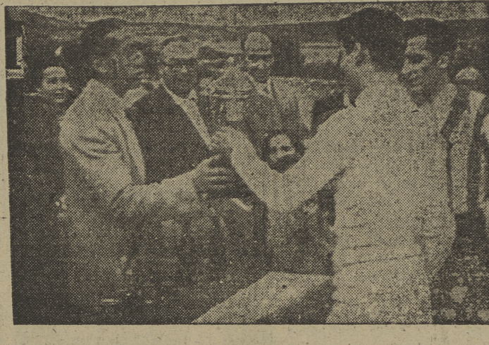
El capitán del equipo de Hostelería de esta capital, "Santa Marta", recibe la copa donada por la Delegación Provincial de Sindicatos, ganada el pasado jueves en el encuentro celebrado en Covarrubias con el conjunto de Salas de los Infantes