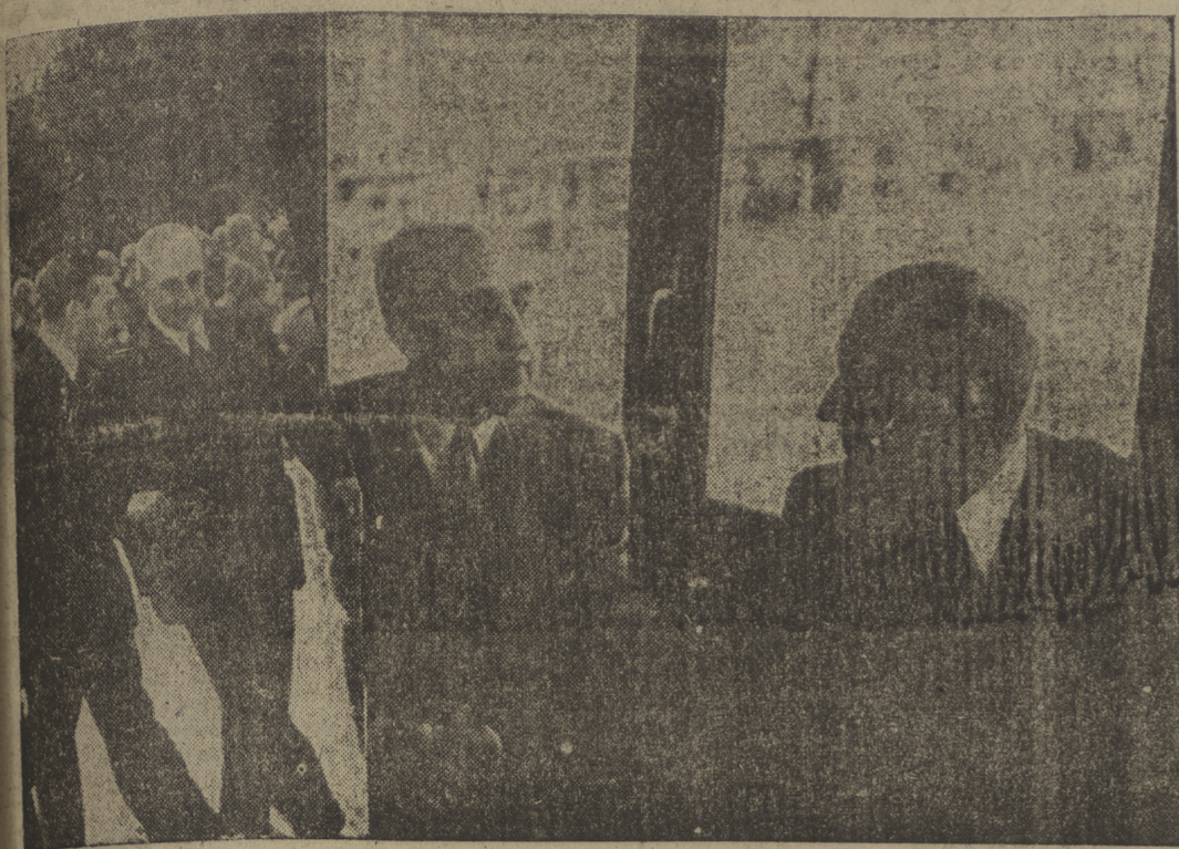
A. E. el jefe del Estado, con el doctor Salazar, en el Club Náutico de La Coruña. En el cliché de la izquierda, ambos jefes de Estado en el curso de su visita al Regimiento de Infantería número 8, de Oporto.