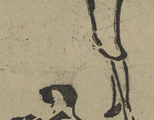
Túnica amplia y colgante, uno de los temas que más éxito ha tenido en la colección de Maggy Rouff. Tres cuartos de satén, suntuosamente guarnecido de renard, recubre un vestido de fiesta.