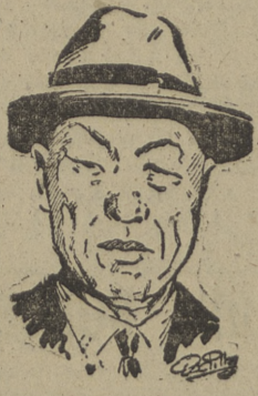
El anciano Shingman Rhee, gran político y batallador, que ha defendido tenazmente la independencia de Corea. Últimamente ha sido presidente de la República de Corea meridional.

Una curiosa costumbre, que no sé de dónde viene, es la de vender los huevos, no por