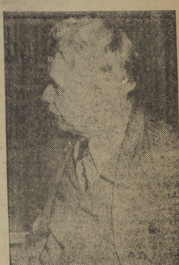
derren sus anteriores gestiones como un fracaso político. (Efe.)

Políticamente, Manuilski ha sido uno de los pocos supervivientes, entre la "vieja guardia roja", de las depuraciones de 1937. Ha estado considerado siempre como uno de los colaboradores más allegados de Stalin. Su ausencia de la delegación ucraniana ha motivado numerosos comentarios en los círculos londinenses. Se cree que obedezca a enfermedad o a que se consiente a enfermedad o a que se consiente