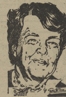
La viuda del presidente F. D. Roosevelt, dama intrépida y bella

conocida de todos los españoles, encamina ahora sus pasos hacia un espectacular aspecto de la vida pública: la asesoría de películas sobre problemas contemporáneos. De momento se dispone a supervisar una producción de Doré Schary que tratará de los conflictos mundiales de la postguerra. Y quien sabe si a lo mejor tiene éxito y se anima a vivir en Hollywood.