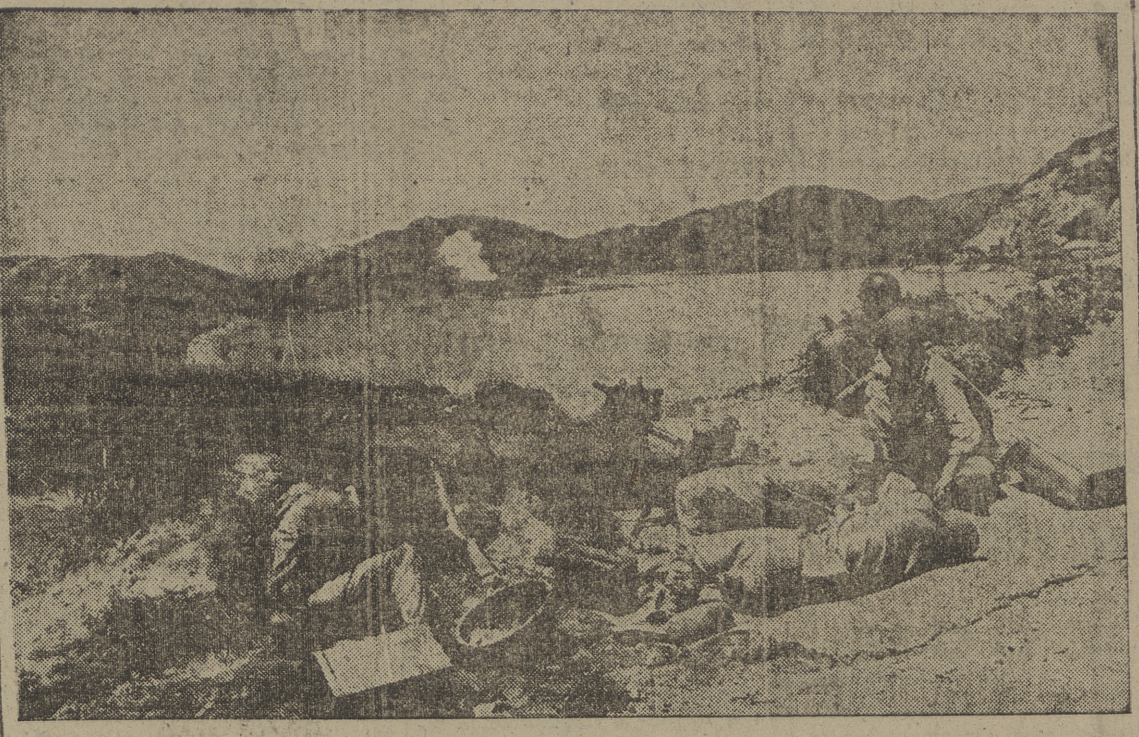
Servientes de una ametralladora norteamericana descansan en su posición estratégica cerca de Yongdok, al tiempo que sobre las posiciones comunistas emerge una gran columna de humo al ser alcanzados algunos objetivos por el fuego de la artillería y aviación

El potencial de los Estados Unidos de Norteamérica, que es tanto como decir el mayor del mundo, está actualmente en manos de este hombre, Stuart Symington. En él radican, con exclusiva responsabilidad ante el presidente Truman, las atribuciones máximas para convertir las posibilidades industriales de la Unión en avasalladora máquina de guerra. Recientemente, con motivo de los sangrientos episodios de Corea, ha manifestado que "si el comunismo internacional ha demostrado no tener escrúpulos en dar un puntapié a quienes estorban en su camino, los Estados Unidos del presente tampoco están dispuestos a ser testigos inactivos de cualquier parte del mundo que se produzca.