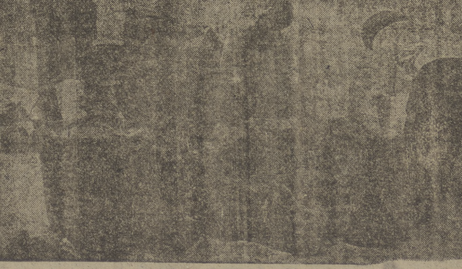
En las orillas del golfo Pérsico es extraordinaria la abundancia de esponjas, que es una de las mejores fuentes de ingreso de los pescadores. Una embarcación que ha pescado las que ustedes pueden ver en la "foto" acaba de soltar su carga en el puertecillo, donde es recogida para la subsiguiente elaboración hasta dejarlas convertidas en esos cuadrados suaves tan útiles para la higiene

Con gran solemnidad se ha inaugurado en Amsterdam el XI Congreso Mundial de Pax Romana, bajo el lema "El intelectual católico; al servicio de la Redención". En la magna Asamblea participan más de mil congresistas