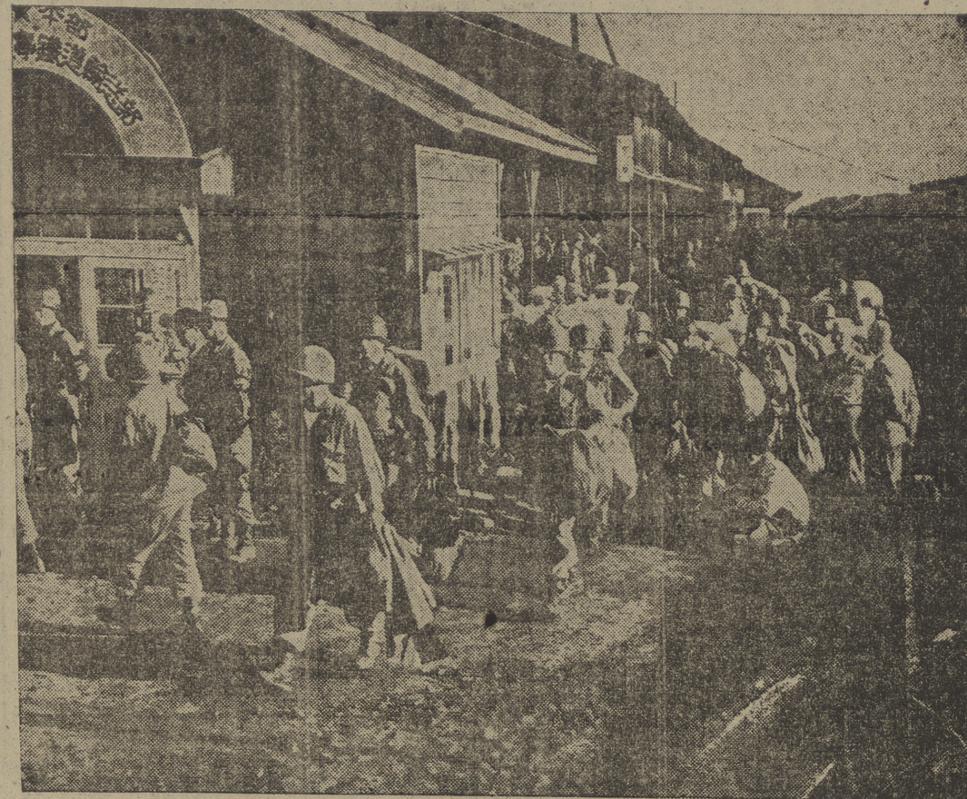
Tropas norteamericanas descendiendo del tren una estación de Corea para dirigirse al frente