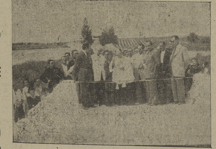
Momento de la inauguración, por el gobernador civil y jefe provincial del Movimiento, de una de las obras últimamente realizadas.

—En las calles hemos observado arreglos de importancia. —Sí, y hasta la fecha llevamos gastadas unas noventa mil pesetas en los dos últimos años en pavimentación y adoquinado. —A la entrada del pueblo vimos árboles jóvenes. ¿Levan a cabo una campaña forestal? —Unos 3.000 chopos han sido plantados, y en la Plaza Mayor y paseo de la Ermita de Nuestra Señora del Río, Patrona de la villa, también se ha llevado a cabo una intensiva campaña. —¿Y las escuelas? —Además de dotar de material necesario a las ya existentes y acondicionar a algunas clases, se llevan muy adelantadas las obras de un grupo escolar, en el que (Sigue en cuarta página.)