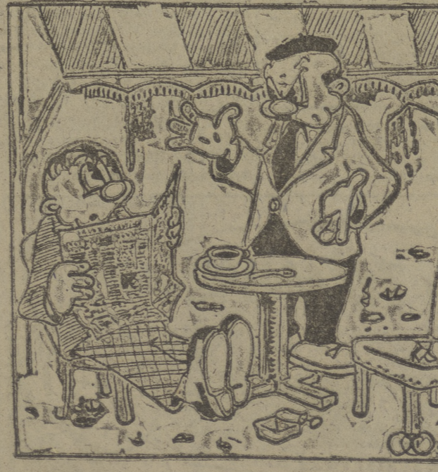
"El monumento debe ser una gran obra de arte, y el Cid debe ir sin casco". — Si, sí... ¡Lo que es una estatua... "al pelo", vamos!

Invento para doblar la potencia distribuidora de energía eléctrica LONDRES, 5. — Un nuevo invento británico, asegura el "Daily Herald", permitirá a la Gran Bretaña doblar la potencia en la distribución de electricidad y la conducción de la corriente eléctrica a todas las casas, granjas y fábricas. Los pilones y cables de la red eléctrica, añade el diario, serán reemplazados por unos proticos de 30 metros de altura y 40 de largo, colocados cada 400 metros y unidos por tubos llenos de gas, dentro de los cuales circulará una corriente de 275.000 voltios. Las pruebas, dice por último el "Daily Herald", se han realizado con resultado satisfactorio. (Efe.)