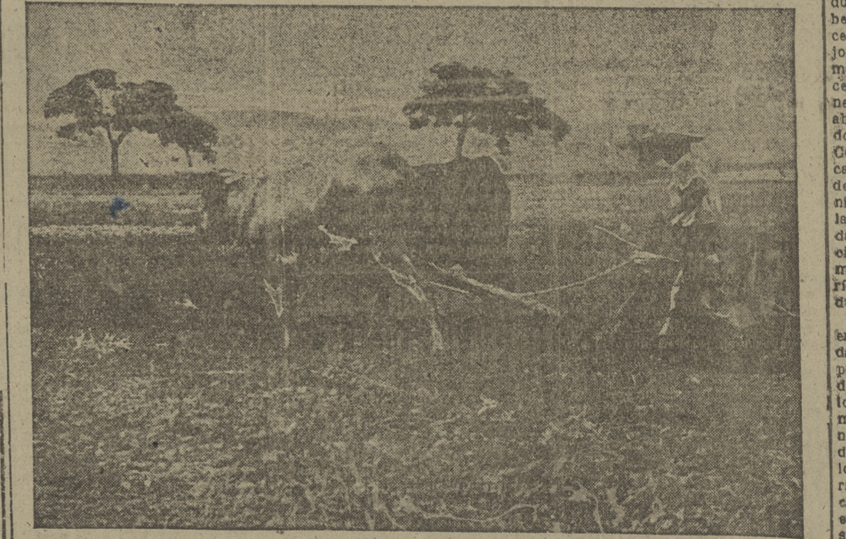
El arado romano sigue siendo el instrumento de cultivo en los campos de la República de San Salvador, aunque paulatinamente se van mecanizando los métodos de trabajo que los labradores españoles llevaron a aquella parte de América.

colocado en el centro de los hoyos o zanjas abiertos al efecto — con la debida anticipación —, de forma que sus raíces inferiores (unas que han de dejarse, resacas cortadas en los 15 centímetros más bajos), se asientan bien abiertas y sobre una capa de la tierra más fértil del campo, bien desmenuzada, siguiendo echándola sobre las raíces y apisonando a su