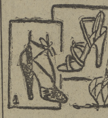
esos conjuntos elegantes y prácticos que lo mismo sirven para sport, para todo andar, para vestir, en fin, que complementan un modelo escogido en las últimas creaciones de los modistos de París. El número 1 representa un zapato en cabra de oro, recubierto de encaje negro (para noche). — 2, modelo de reptil gris claro. — 3, bolso en gros-grain blanco, con redelicia grues azul marino.

fuera de la residencia familiar, y unos 1.000 dólares si es en ésta. Realizar tales gastos y el esfuerzo mental de los estudios para terminar, como a muchos jóvenes lienciados les ocurre, despachando coca-cola, helados y bocadillos detrás de un mostrador, transportando viajeros en taxi o sirviendo clientes en un restaurante, es un sacrificio que no les vale la pena.