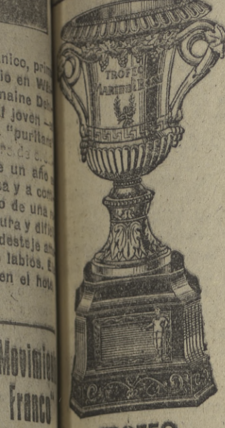
TROFEO MARTINI & ROSSI