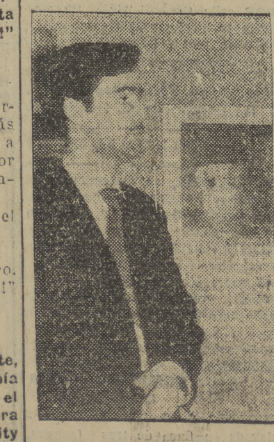
Conocíamos a Ginés Liebana por sus dibujos. Aparecidos en el extinguido semanario "El Español" y otras muchas revistas de altura. Siempre nos llamaron la atención esas ilustraciones delicadas, suaves, convincentes. Y pensábamos que esa obra tenía que ser fiel reflejo de la personalidad del artista. Por eso, aprovechando la co-