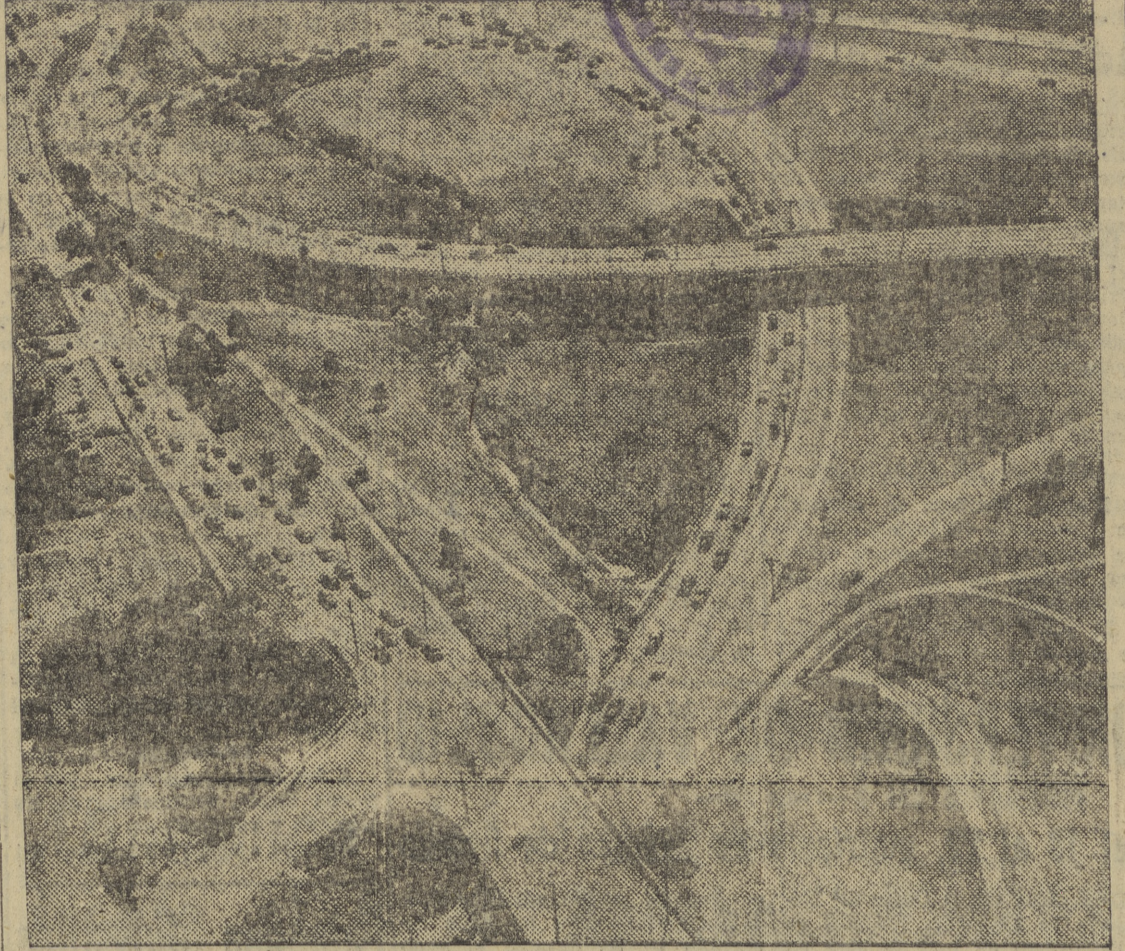
En esta fotografía se puede observar el movimiento que reina en una de las arterias de tráfico que conducen de Nueva York a las playas, donde los habitantes de la gran urbe norteamericana pueden olvidar un poco el calor. Ustedes pueden imaginar libremente lo que será el laberinto este cualquier domingo. ¡Para marearse!