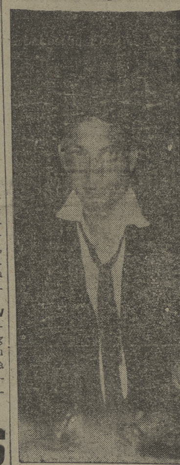
El asesino del primer ministro egipcio

Terminó Spaak con un llamamiento a los pueblos de los países representados en la Asamblea europea para que apoyen a sus representantes "en este momento histórico". (Efe.)