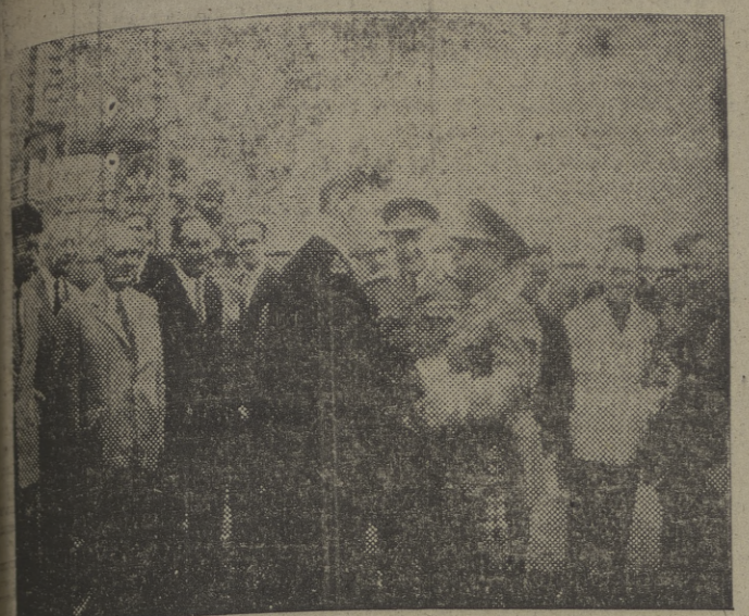
Su Excelencia el jefe del Estado, acompañado de los ministros de Obras Públicas, Industria y Comercio y Marina y otras personalidades, es saludado por el ingeniero jefe de la mina "La Camocha" a su llegada a dicho lugar durante su visita a Gijón.