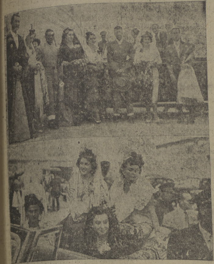
Arriba: Las madres del festival taurino organizado por la Asociación de la Prensa a beneficio del Asilo de Ancianos, llegan a la plaza y posan un momento con los diestros que intervienen en la lidia. -- Información en páginas interiores.