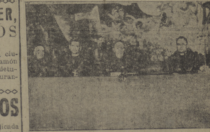
El excelentísimo y reverendísimo señor arzobispo, doctor Pérez Platero, preside la apertura de la II Semana de Estudios Misioneros.

MADRID, 8. — La población española aumenta en unos doscientos mil habitantes por año, por lo que se prevé que para el censo de 1950 España habrá crecido en otros dos millones. La vida media del hombre es de cincuenta y tres años y sesenta y uno en la mujer. La mayor proporción de nacimientos la dan las provincias de Las Palmas y Toledo, con el 29'82 por mil y el 25'99 por mil. (Cifra.)