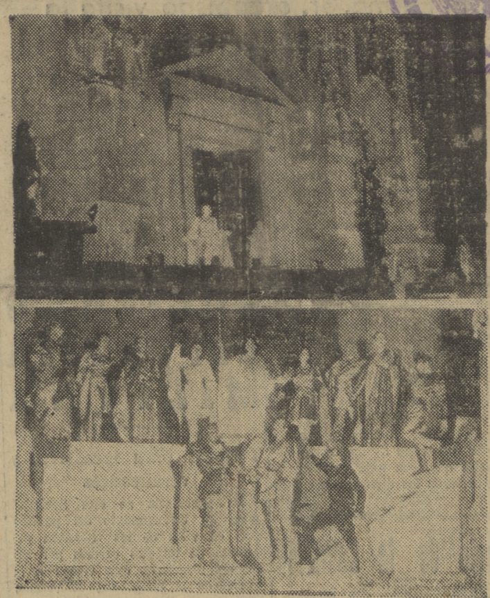
Dos momentos de la representación del auto sacramental "La vida es sueño", en el atrio de la Catedral.

— Oiga, joven... La carretera de Logroño... ¿me hace el favor?