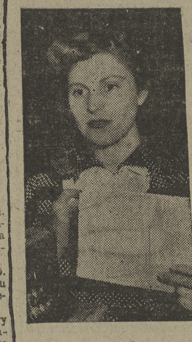
Con un aparato registrador de sonido presentado por la Bairn Televisión, de Inglaterra, se cree haber dado un paso decisivo en el campo de la cinematografía. Esta señorita añade el diálogo o monólogo a una película hablando simplemente por el micrófono