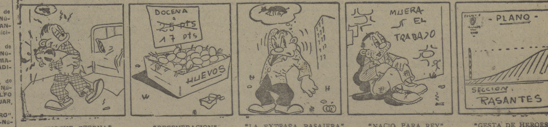
"NOCHE ETERNA" "REGENERACION" "LA EXTRAÑA PASAJERA" "NACIO PARA REY" "GESTA DE HEROES"