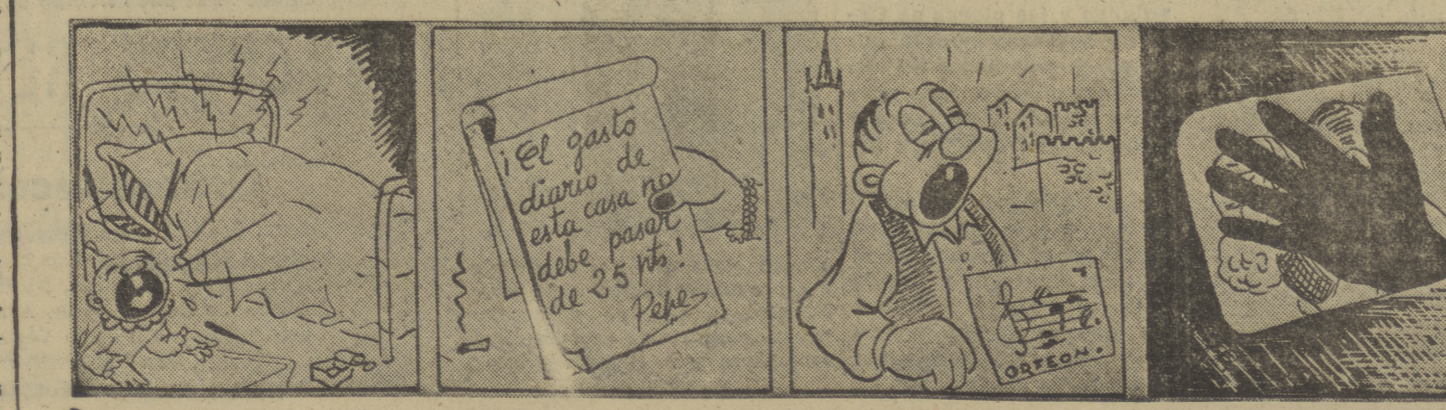
"UNA CANCION EN LA NOCHE" "MI MARIDO ESTA LOCO" "UNA SEMANA DE FELICIDAD" "EL FERGER SE" (No apta)