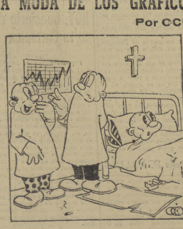
...Como siga así... seguro que se clasifica!!