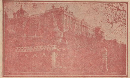
Palacio Real, de Madrid