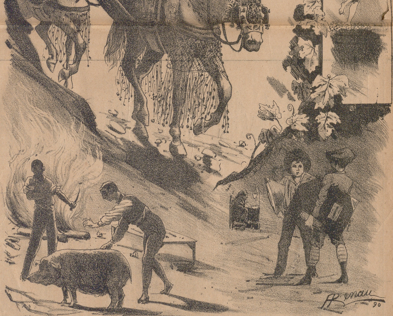
ALEGORIA DE OCTUBRE, por Renau .