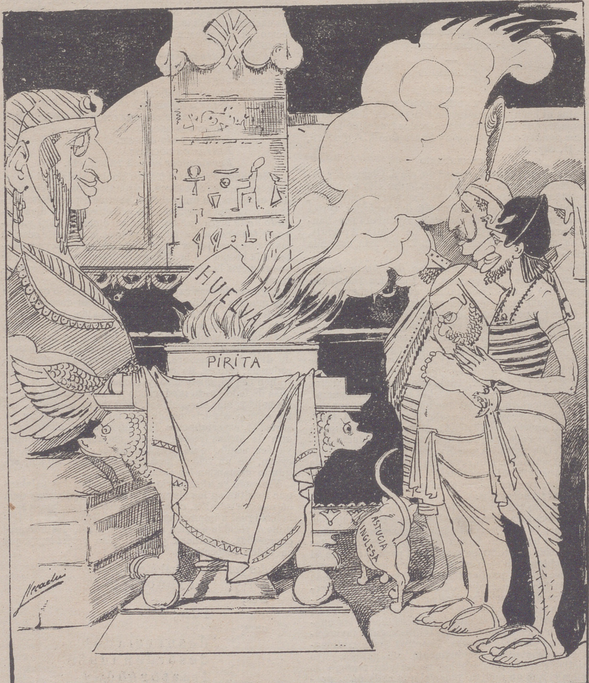
SACRIFICIO OFRECIDO AL DIOS AUREO POR LOS FAL- SOS SACERDOTES FUSIONISTAS