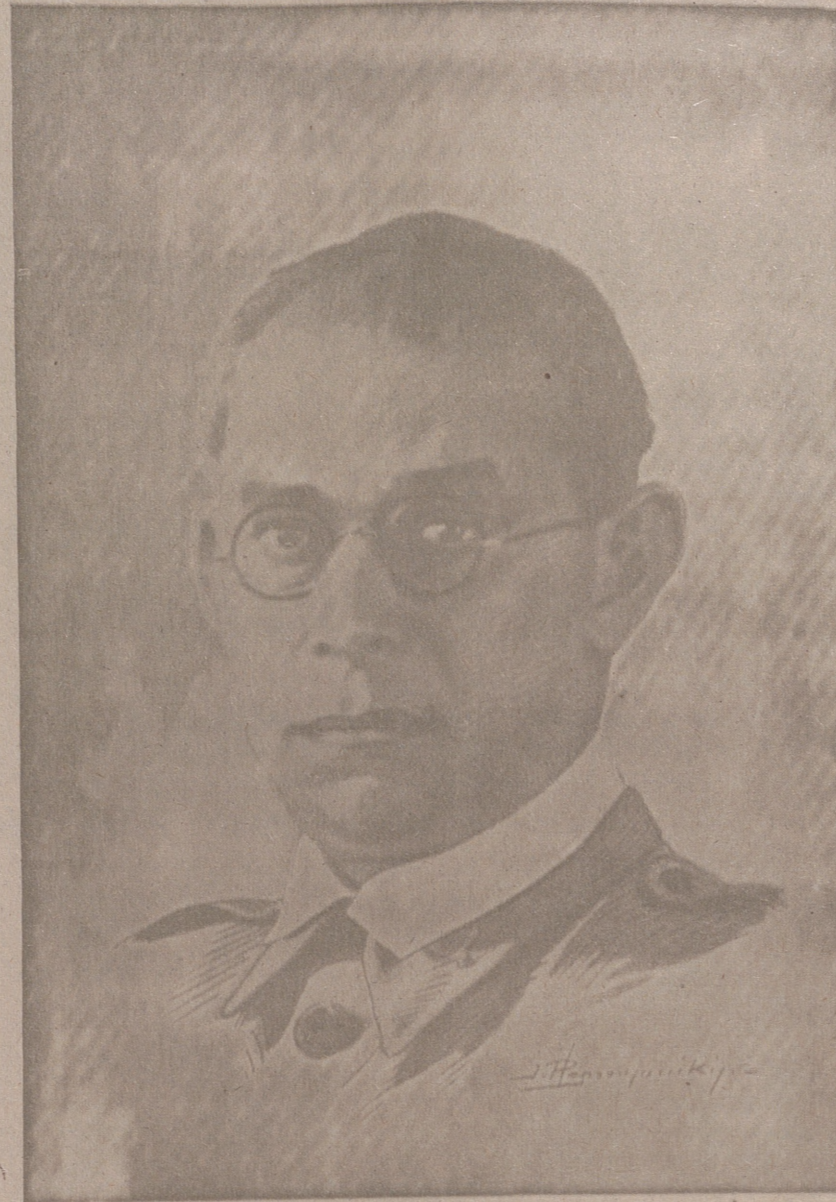
El malogrado general Mola jefe que fué del Ejército del Norte

La caridad me, el egoísmo separa, ayuda a tus hermanos reducidos contribuyendo en la suscripción de AUXILIO A POBLACIONES LIBERADAS.