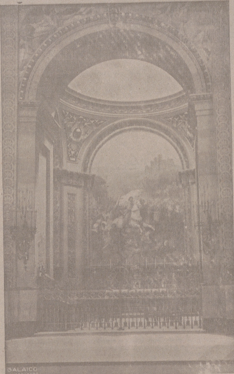
SANTIAGO, PATRON DE ESPAÑA (Cuadro de San Francisco el Grande, de Madrid.)