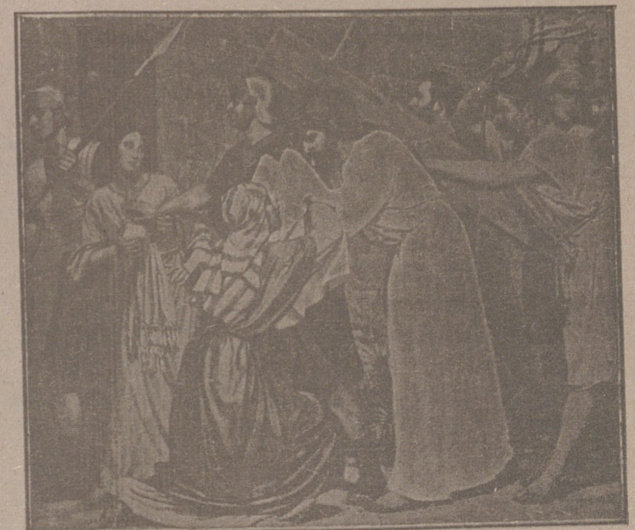
Piedad de la Verónica

¡Viernes Santo! En este día entregó Dios a los hombres un instrumento maravilloso para transformar el dolor en amor, como se transforma en fuego un salto de agua. La filosofía del dolor ha de hacerse sobre el cadáver de un Dios Crucificado. (Gar-Mar).