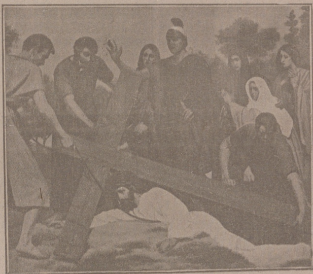
Una caída de Jesús