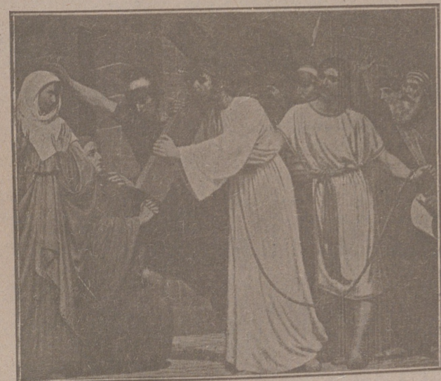
Jesús y las mujeres de Jerusalén