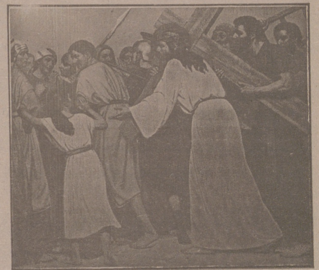
Jesucristo y el Cirineo