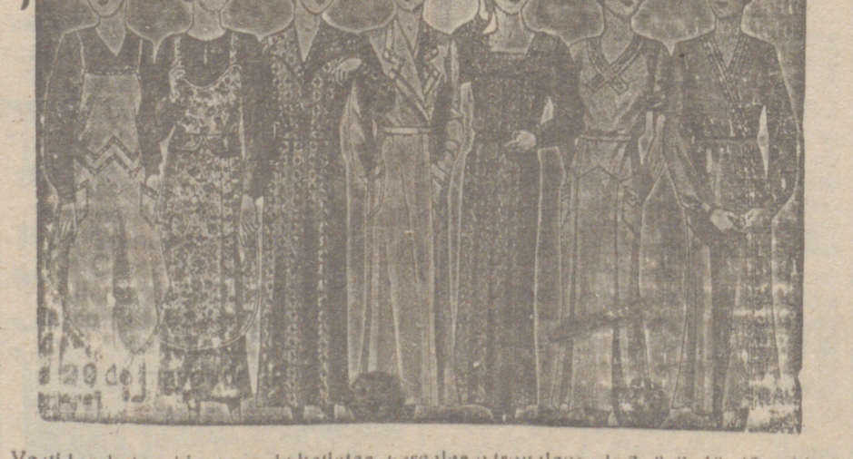
Vestidos, batas, blusas de bailarinas, percales o trovitecos, de 7, 8, 9, 10, 12 y 14 pts.

Primera casa en conexiones para caballero, señora, jóvenes y niños. Tejidos, Pañería y Sustrería