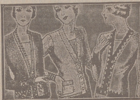
Blusas chaquetillas, de 7, 8, 10, 12 y 15 ptas.