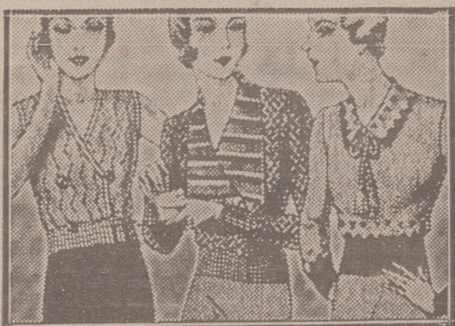
Blusas punto novedad, a 5, 6, 8, 10 y 12 ptas

Primera casa en confecciones para caballero, señora, jóvenes y niños Teñidos, Pañería y Sastrería