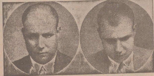
12 años calvo 10 meses después curado

De nueve a una mañana y de dos a ocho tarde, visitará, gratuitamente y a domicilio, avisando previamente a dicho HOTEL. Instituto J. Mourade. Barcelona. Rambla de las Flores, 4. 1.º. Bn Madrid, Fuencarral, 15.