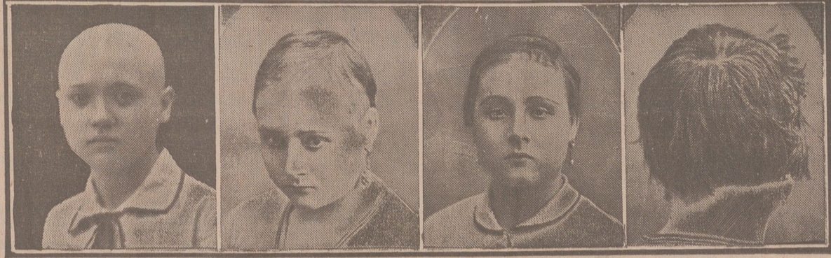
14 años 5 meses 8 meses 12 meses

65.000 cartas afirman la eficacia. 150.000 casos curados en el mundo entero, reconocidos por las autoridades españolas y extranjeras. Inventor del CAPILAR J. MOURADE, universalmente conocido por sus maravillosas curas (muy conocido en España por haber curado una infinidad de casos rebeldes de calvicie), estará el JUEVES, VIERNES Y SÁBADO en esta ciudad, en el HOTEL PARIS, donde recibirá las consultas de los interesados en su maravilloso específico, exponiendo los casos curados, después de 30 años de calvicie.