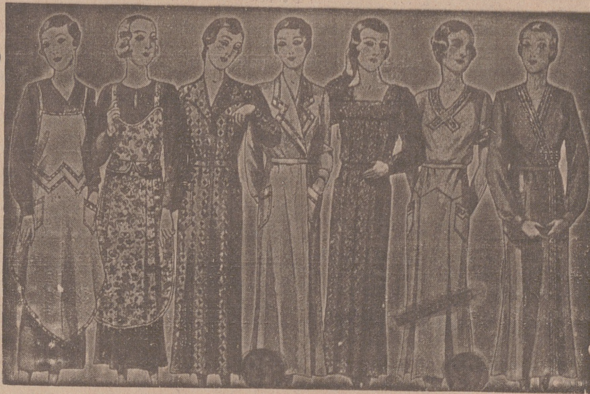
Vestidos, batas, kimonos de bañistas, percales o trovalcos, de 7, 8, 9, 10, 12 y 14 ptas.

Casa Munguía Plaza Mayor, 48 y Lain Calvo, 9 Sucursal: Plaza Mayor 5 BURGOS Primera casa en confecciones para caballero, señora, jóvenes y niños Tejidos, Pañería y Sastrería