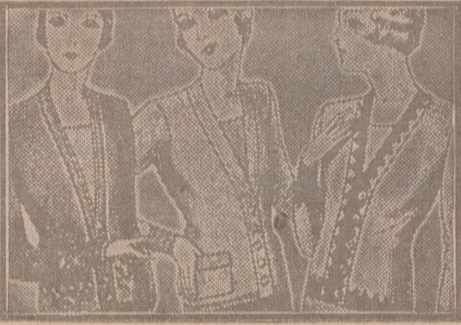
Blusas chaquetillas, de 7, 8, 10, 12 y 15 ptas.