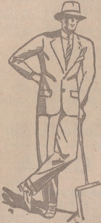
Trajes de paño, confección fina, de 60, 70, 80, 100 y 120 pesetas. GRANDES SURTIDOS