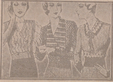
Blusas punto novedad, a 5, 6, 8, 10 y 12 ptas

Primera casa en confecciones para caballero, señora, jóvenes y niños Tejidos, Pañería y Sastrería