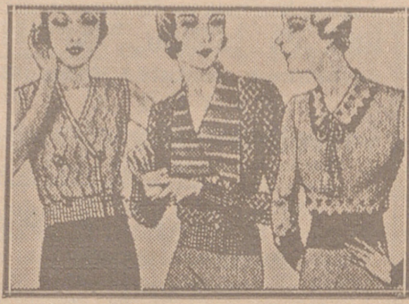
Blusas punto novedad a 5, 6, 8, 10 y 12 ptas.

Primera casa en confecciones para caballero, señora, jóvenes y niños Tejidos, Pañería y Sastrería