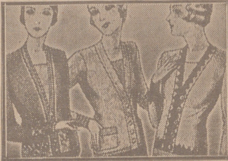
Blusas chequillitas de 7, 8, 10, 12 y 15 ptas.