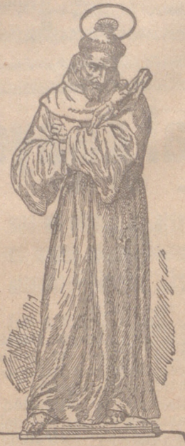
"EL CRISTO DE LA EDA MEDIA" "EL HERALDO DEL GRAN REY"

He aquí el hombre que con su cuerda ha influido más en el mundo, que con su espada los más poderosos conquistadores, Napoleón. He aquí el promotor de una revolución nunca vista ni oída, en bien de la humanidad, sin armas ni medios que el amor. (Sabatier). Revolución o movimiento que es la mayor obra popular que recuerda la historia. (Renán). He aquí la flor de los caballeros, el Señor del amor, tuito seráfico en ardore... (Dante). El más ardiente, el más arrebatado, y si es lícito hablar así el más desesperado amante de la pobreza, que haya existido en la Iglesia, (Bossuet).