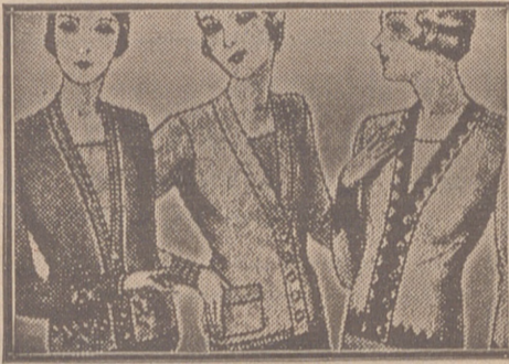
Blusas chaquetillas de 7, 8, 10, 12 y 15 ptas.