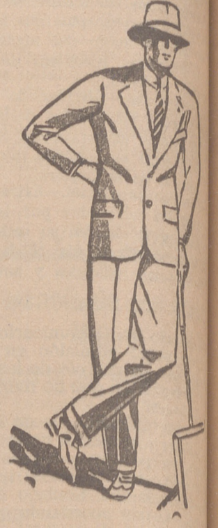
Trajes de paño, confección de 60, 70, 80, 100 y 120 pesetas. Grandes surtidos