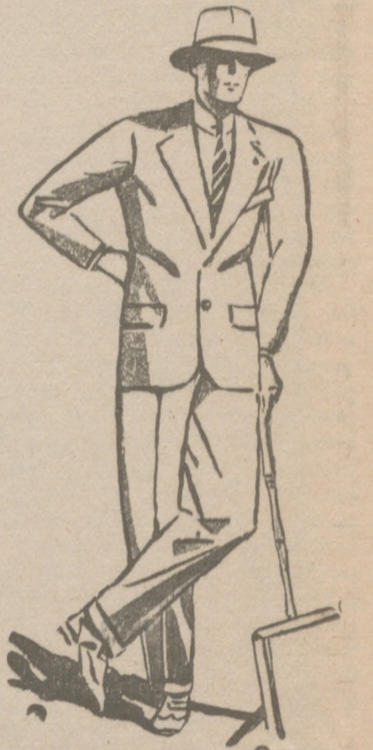
Trajes de paño, confección fina, de 60, 70, 80, 100 y 120 pesetas. Grandes surtidos.