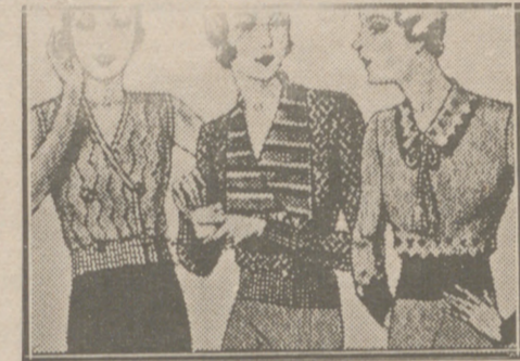
Blusas punto novedad a 5, 6, 8, 10 y 12 pias.

Primera casa en confecciones para caballero, señora, jóvenes y niños. Tejidos, Pañería y Sastrería.