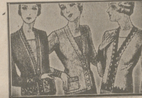
Blusas chaquetillas de 7, 8, 10, 12 y 15 pias.