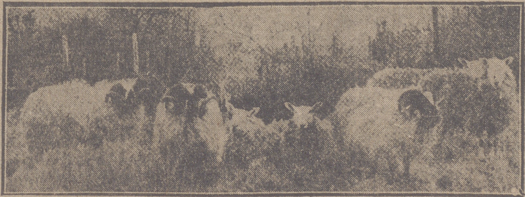
Este grupo de carneros Leicesters y Blackface fueron premiados en uno de los últimos cursos celebrados en Inglaterra y adquiridos más tarde para mejorar una cabana extranjera