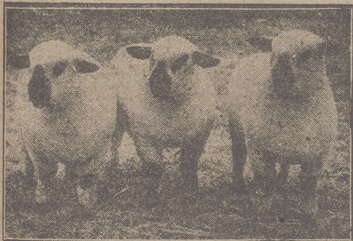
Tres hermosos borregos de raza Hampshire Dow, que formaban el lote ganador del premio concedido a esta raza en la última exposición de Inglaterra.