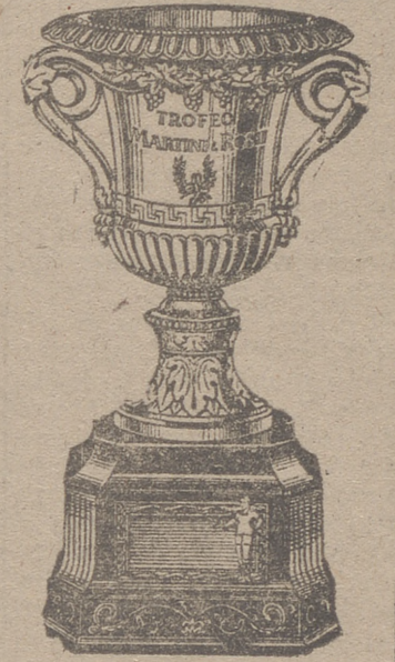
TROFEO MARTINI & ROSSI

En el grupo segundo "Ramiro Ledesma" vence a "Mandos" B por 21-3 y "Giron" A a "San Fernando" por 2-0.