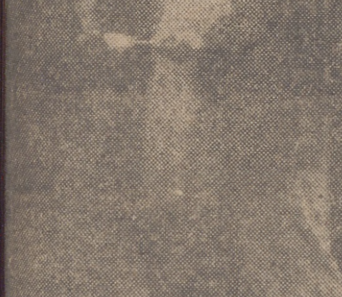
El Delegado Sindical haciendo la entrega a un beneficiario

EN PEÑAFIEL Entrega de viviendas de la Obra del Hogar