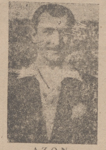
A Z O N