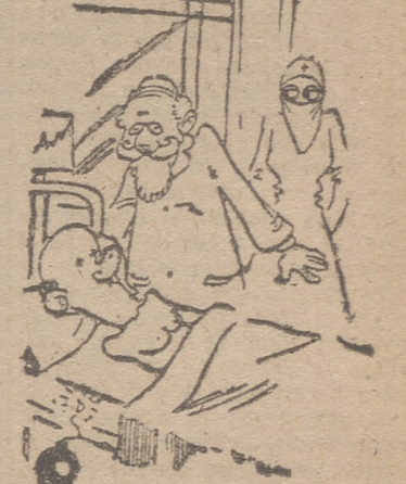
—¿Este señor hay que hacerle otra operación. —Pero, ¿qué tiene? —¡Dinero!