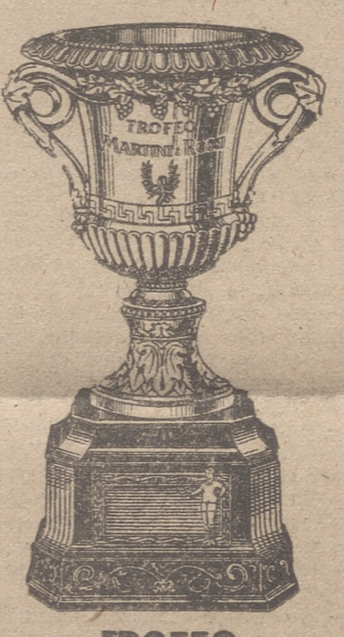
TROFEO MARTINI & ROSSI