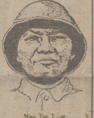
Mao Tse Tung