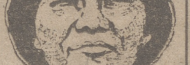
Mao Tse Tung

La Habana, 21.—Ha sido asesinado a tiros en el balneario de los universitarios, en las afueras de esta capital, Gustavo Mejías, de 29 años de edad, presidente de la Escuela de Ciencias Sociales. Se cree que la agresión no obedece a motivos políticos. El agresor no ha sido detenido. Un testigo acusa como autor del atentado a Modestino González del Valle, quien, con su hermano, explota la cantina del balneario.—Efe.