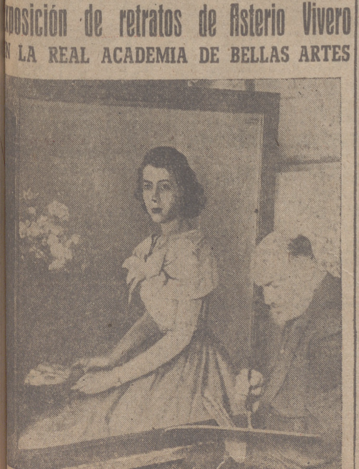
Exposición de retratos de Asterio Vivero en LA REAL ACADEMIA DE BELLAS ARTES