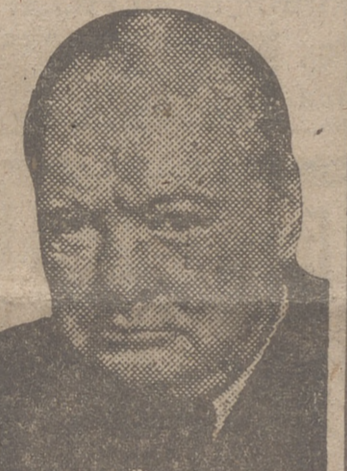
El ministro de Hacienda francés achaca a Inglaterra la devaluación del franco

Al terminar su discurso, el Papa dijo: «Está muy bien que las familias del mundo se unan para ayudarse mutuamente para contener y dominar a las fuerzas del mal por su vigor sano y fértil. Queda otro peso por dar: establecer el espíritu de la familia cristiana sobre un nivel nacional, internacional y mundial. Lo mismo que una familia particular no es la simple reunión de sus miembros bajo el mismo techo, así también la sociedad debe vivir con un espíritu familiar basado en un común origen y destino. No son solamente las cuestiones angustiosas de la economía continental y mundial las que, vistas desde tal punto, recibirían una sensible mejora y ayuda benéfica. La obra que queda por cumplir es, pues, inmensa. Puede realizarse sólo por progresos sucesivos.»