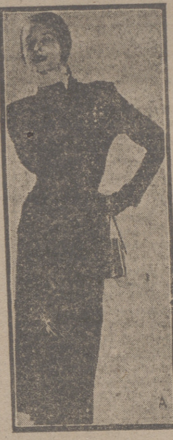
Un detalle que suaviza este vestido austero de gruesa lana es la gasa rizada que adorna el cuello. En la ciudad es el modelo indicado para llevar al anochecer. Lleva las mangas largas. El motivo del cuello se repite alrededor de los drapeados de la falda.