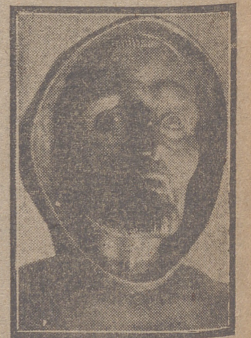
Detalle de la «Cabeza de San Francisco»

Si tami disci Sabi estab amb la a la muy Dr. del cencillo mas chill que res inici dad, acer nos fuer men que form en u, inter rido dicac ria, la co te, r meje pañi la do de l can Me idua to; g para alud muy pie r ar espa