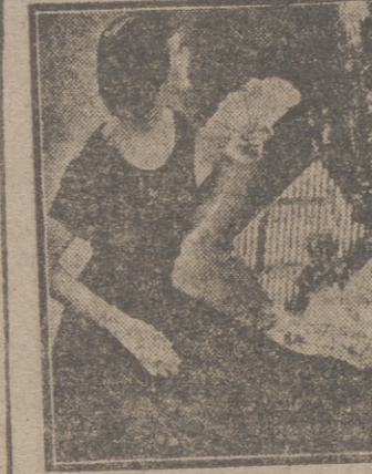
Este sencillo vestido tiene un bonito aspecto. Es una buena elección para ataviarse una jovencita en las fiestas de tarde. Confeccionado con tafetán, fue diseñado por Henry Rosenfeld. El detalle de este modelo son los adornos de la falda, a la que dan una bella vistosidad, y consiste en unas cintas arrolladas en espiral como si fuesen unos cordones. El cuerpo es sencillísimo con el escote redondo bastante amplio y las mangas cortas. La falda es amplia. Un delicado abanico, alfiler monograma y guantes, son los complementos para darle el aire de fiesta.