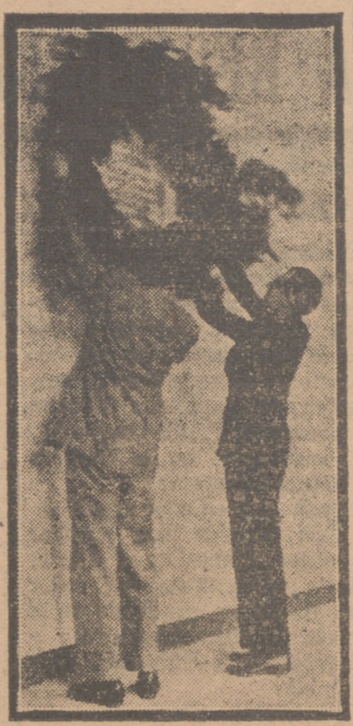
Colocación de una corona en la lápida dedicada a los estudiantes caídos en el Colegio de Santa Cruz