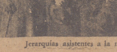
Jerarquías asistentes a la misa del Santuario