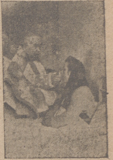
fantes del Santuario Nacional entonaron cánticos religiosos durante el brillante acto.

Para celebrar tan solemne fiesta se instalaron ocho altares en los distintos pisos del Sanatorio, adornados por los enfermos con esmerado gusto. Los in-