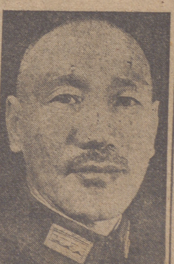
Nankin, 1.—El generalísimo Chang Kai Chek, en el discurso