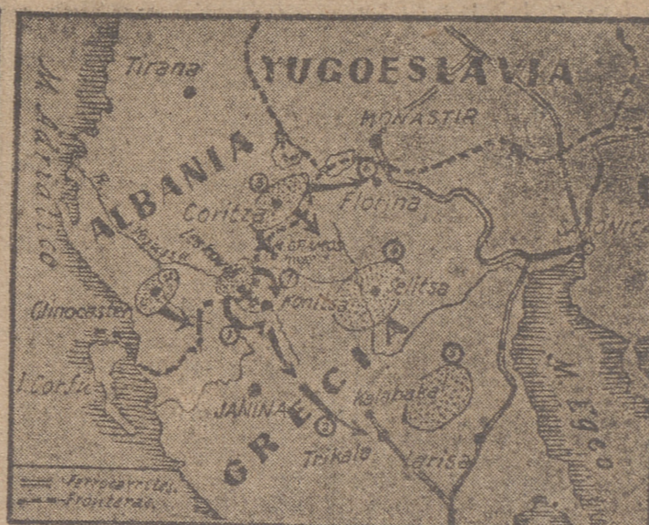
Las zonas punteadas indican los lugares donde se organizan y operan las partidas de guerrilleros en territorio albanés y en Grecia

Atenas, 1.—La emisora «Grecia Libre» y democrática del «general» Markos ha radiado un mensaje de año nuevo de dicho cabecilla, en el que incita a sus secuaces a luchar duramente aún contra los «monárquicos fascistas y los imperialistas norteamericanos» en el año entrante, «que será de gloria y de éxitos.»—Efe.